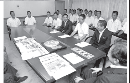
甲子園「5年前を超える」唐津商ナイン、市長に抱負